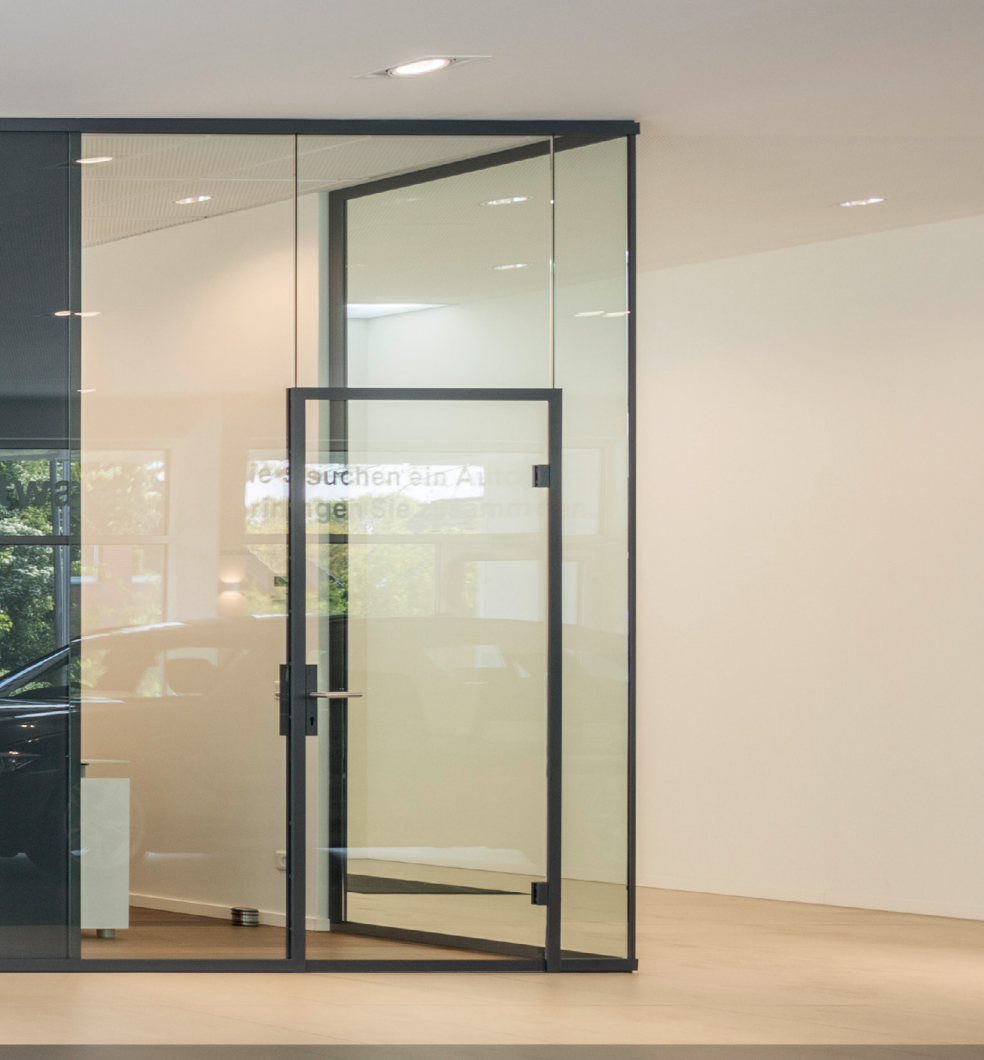
Referenz: BMW Greiwing, Münster

Bau- und farbgleiche Verbindungselemente mit hohen Passgenauigkeiten sorgen für die benötigte Stabilität.